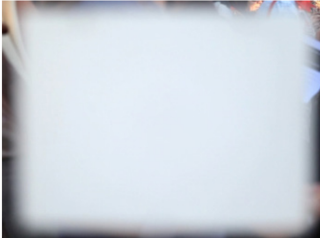
Film à blanc, vidéo, 4/3, 3 mn, 2013

Vernissage le jeudi 19 mars de 18h à 21h