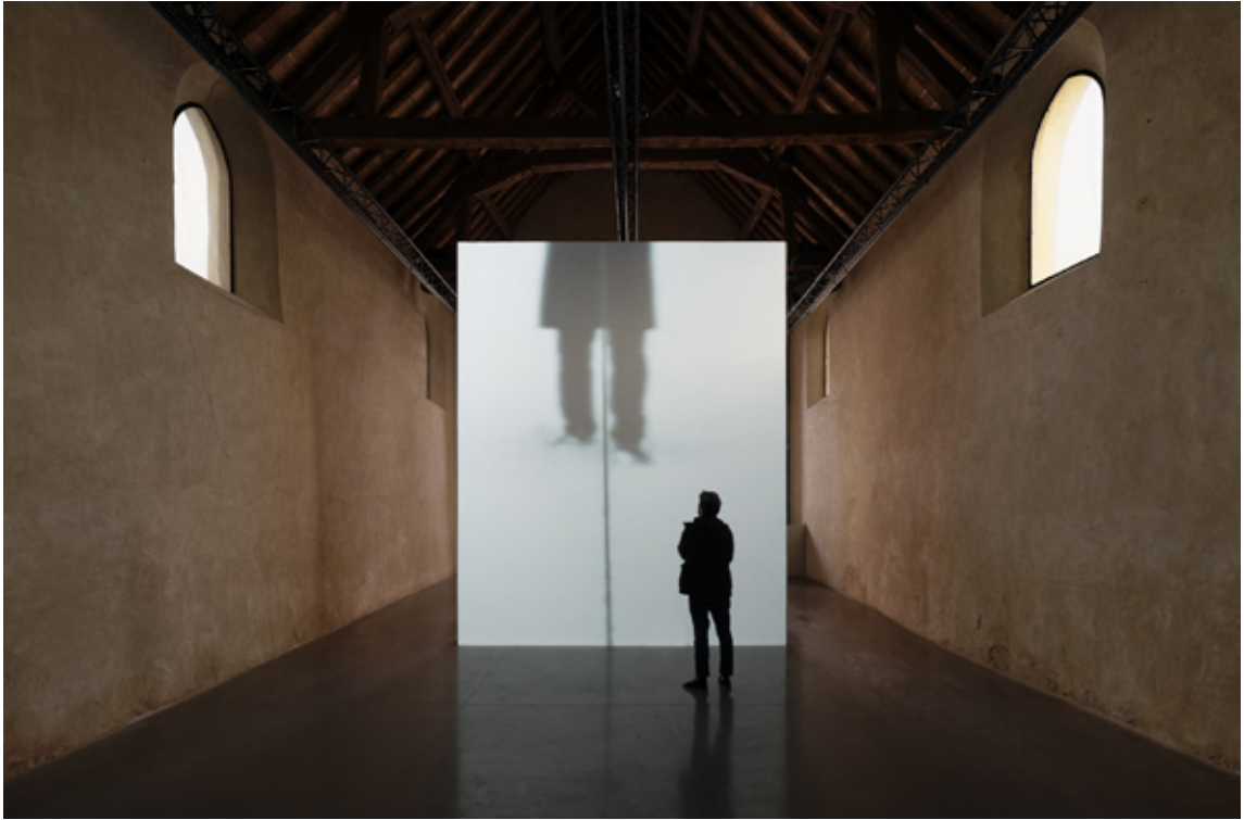
Denouement , vidéo, 7 mn, 2011