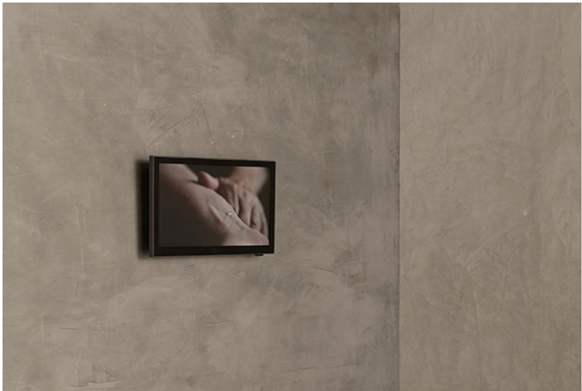
Ligne , vidéo, 1 mn, 2011