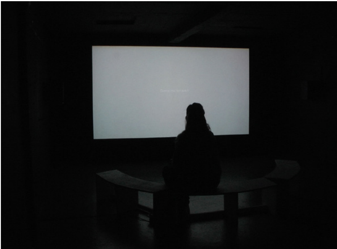
Vues de l'exposition, Sommeils , Espace Khasma, Les Lilas, 2014